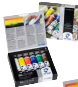
Setverpackung mit 6 Tuben 20 ml

Neben einem umfangreichen Sortiment an einzelnen Tuben sind Setverpackungen mit den wichtigsten Basisfarben, ein Kombiset mit Zubehör und verschiedene Holz Malkästen erhältlich. Suchen Sie ein besonderes und kreatives Geschenk? Überraschen Sie jemanden mit einem Ölfarbenset oder einem Holz Malkasten!