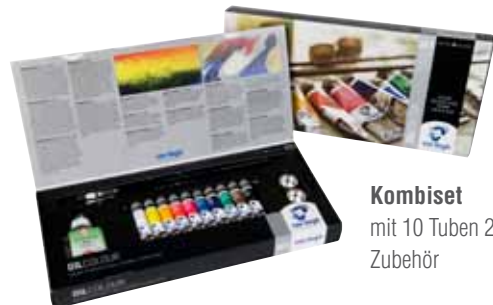
Kombiset mit 10 Tuben 20 ml und Zubehör