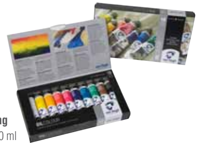
Setverpackung mit 10 Tuben 20 ml