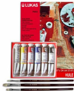
LUKAS STUDIO ÖL Einsteigerset Art.-Nr. 6482 SET2

LUKAS Studio Ölfarbe ist mit allen anderen LUKAS Ölfarben mischbar. Ob LUKAS 1862 Ölfarbe, LUKAS Terzia Ölfarbe oder LUKAS Berlin wasser-mischbare Ölfarbe – alle Produkte können problemlos miteinander verwendet werden.